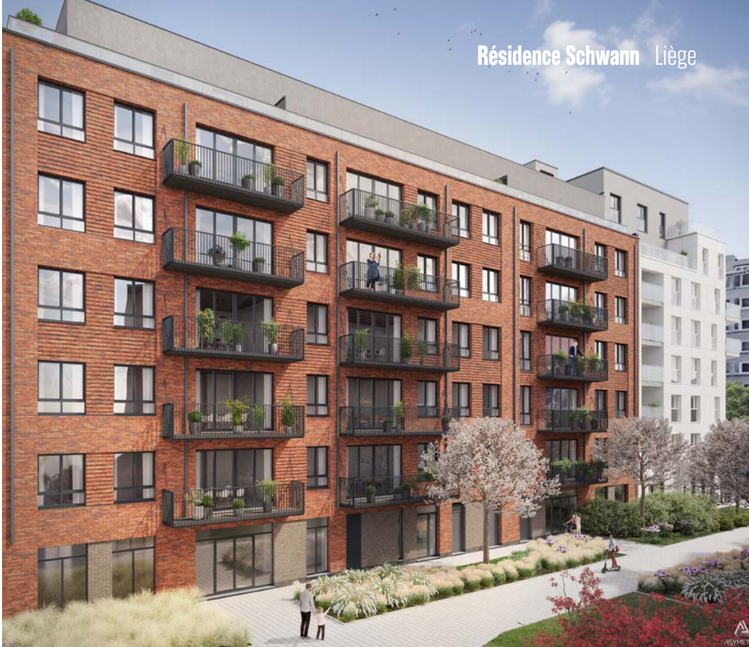
Parmi les enjeux urbanistiques figurait une densité maîtrisée au profit d'un espace public extérieur vaste et de qualité dont environ 70% en pleine terre.

Parmi les défis en conception, l'intégration d'une crèche au rez-de-chaussée de l'ensemble de logements a été relevé grâce à une intégration paysagère en intérieur d'îlot visant à limiter les contacts visuels et physiques entre habitants et enfants.